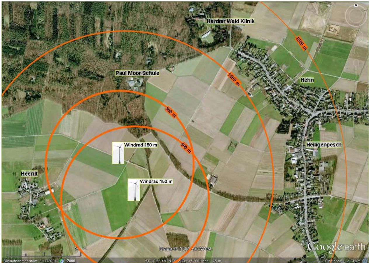
Anlagen südlich vom Hardter Wald